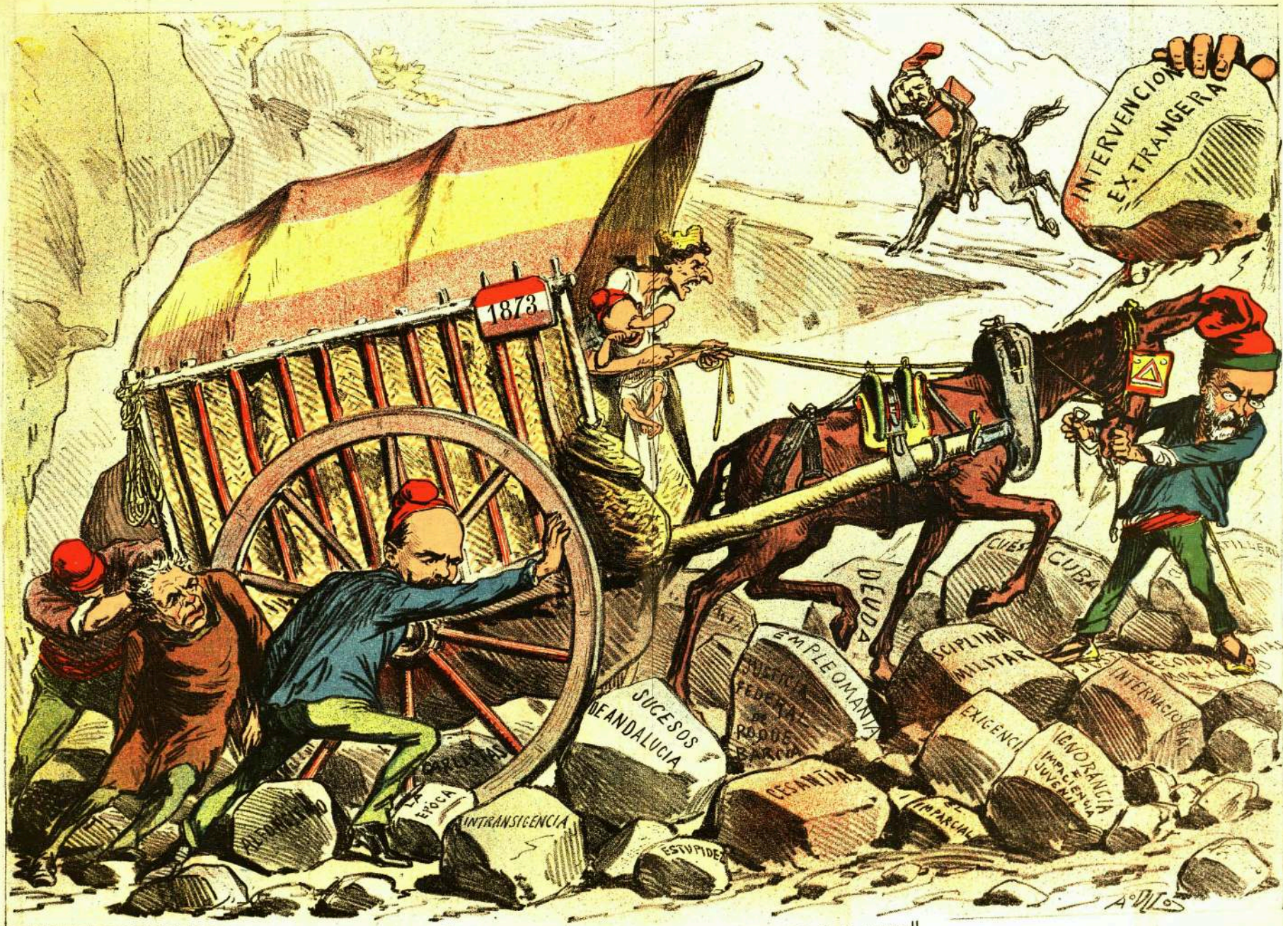
SI NO HECHA MANO DEL LATIGO ¡¡AY DEL CONDUCTOR Y EL CARRO!!