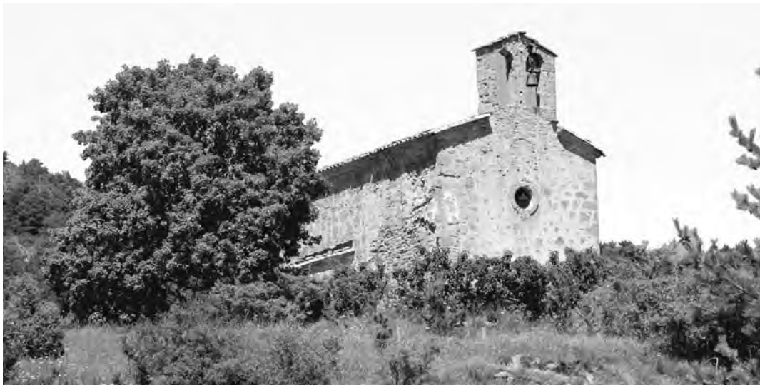
Església parroquial de St. Cristòfol de Busa.