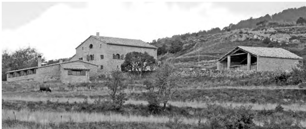
La Bartolina, en procés de rehabilitació.

Amb les terres que hi ha actualment es poden sembrar més de 200 quarteres de blat, que produïrien de mitjana unes 1.600 quarteres. Però atesa la seva extensió, aquesta quantitat es podria doblar.