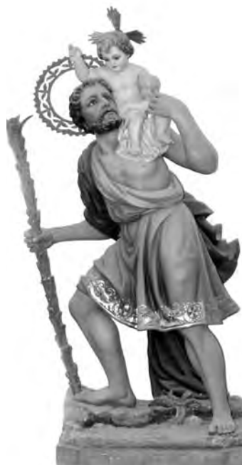
Imatge de St. Cristòfol, patró de la parròquia de Busa.