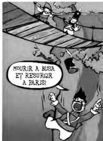
Còmic on es representa els presos, que abans de morir de fam i altres calamitats, preferien tirar-se al buit.

¿No és sospitos que una persona amb l'orella sempre a punt per captar notícies, i molt relacionat amb els militars, no deixés constància d'un acte al qual van assistir tants soldats i tanta gent del país? Costa d'entendre.