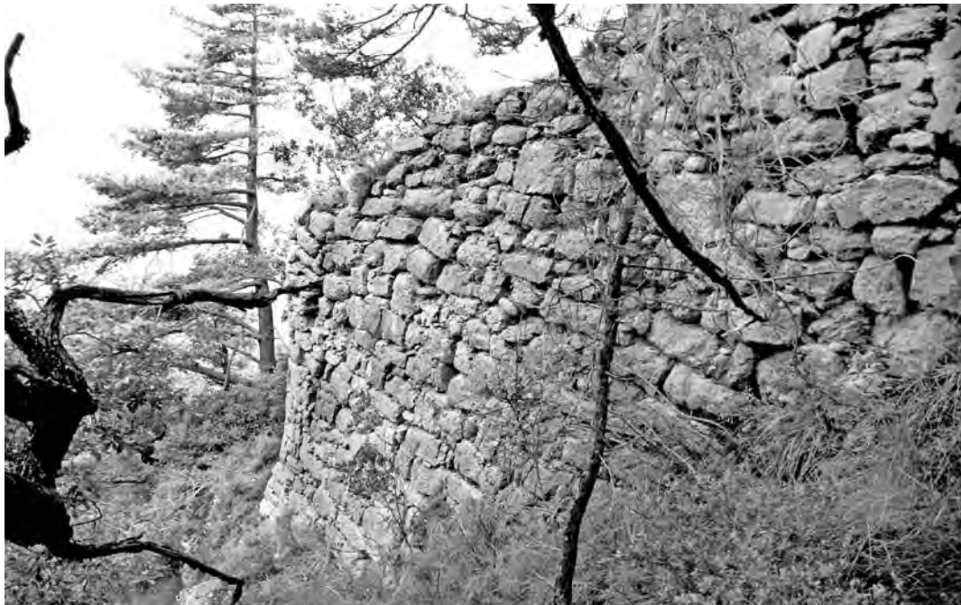
Al Grau de la Guàrdia, a ponent de l'illa hi resta una bona part del mur de fortificació fet amb pedra arrancada de l'entorn.