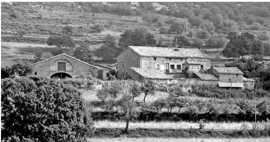
Casa Rial, al bell mig del pla, dedicada a la restauració.