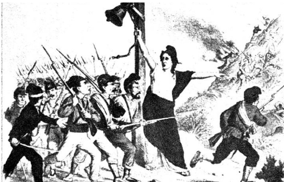
¡Republicanos, a la montaña!

que es preciso anclar á grandes remedios para conjurar la gravedad de la situación. Vich está seriamente amenazado y es preciso que las autoridades estén alerta para las consecuencias del desastre de Alpens no sean mas funestas todavía.