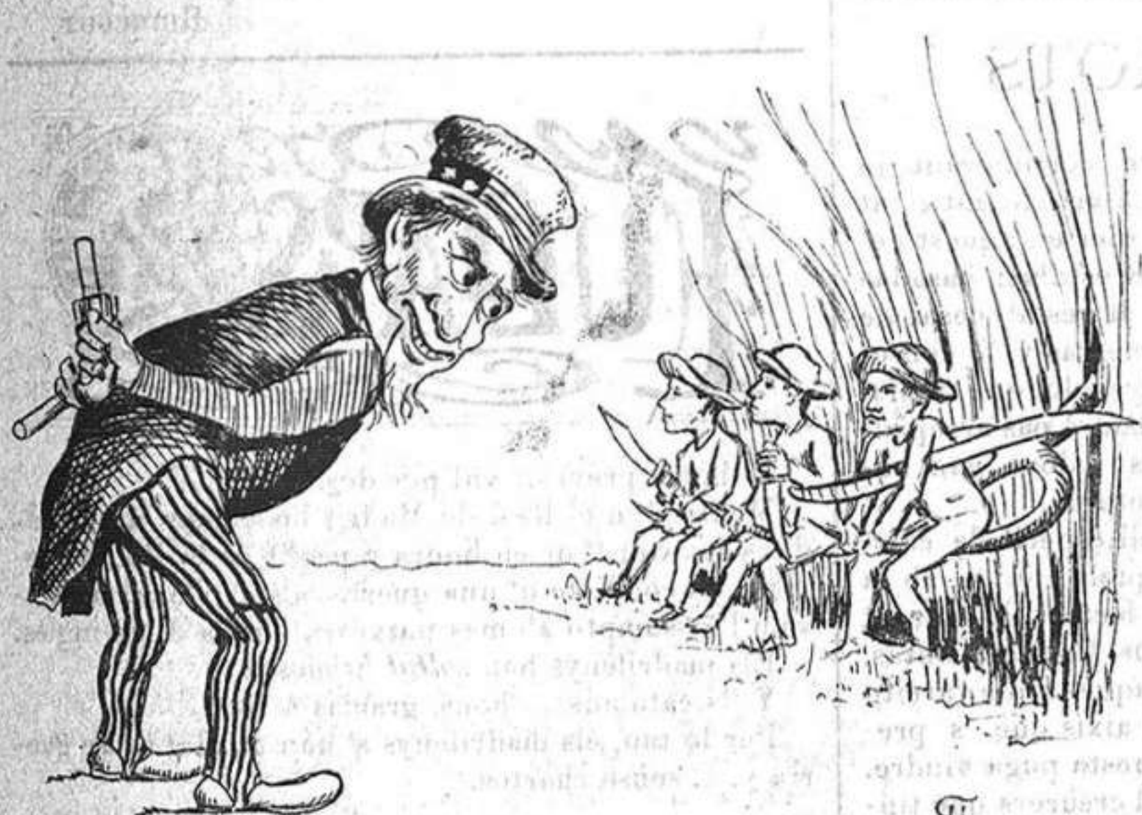
—Ustedes ser cuatro gatos medio esmortuidos de fam.....

Administració: Fontanella, 5, entressol, 1. a — La correspondencia al Administrador