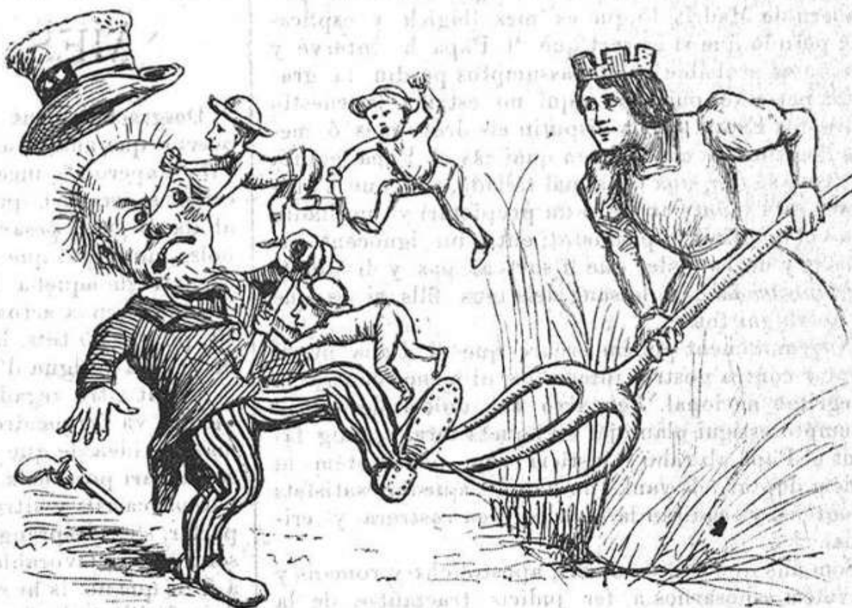
Si Espanya 'ls dona una empenta, Deu t' ampari, oncle Sam....!