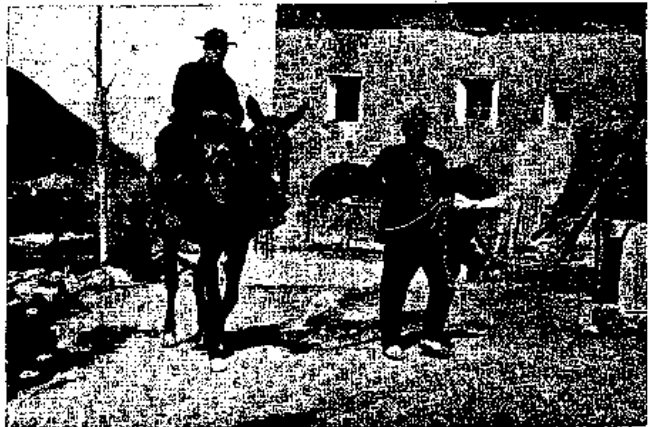
Cap a una altra pagesia

Acabada la benedicció surten a fora portant el mosso el plat amb la sal mullada i el boix xopat d'aigua beneïta. El capellà amb la ma-