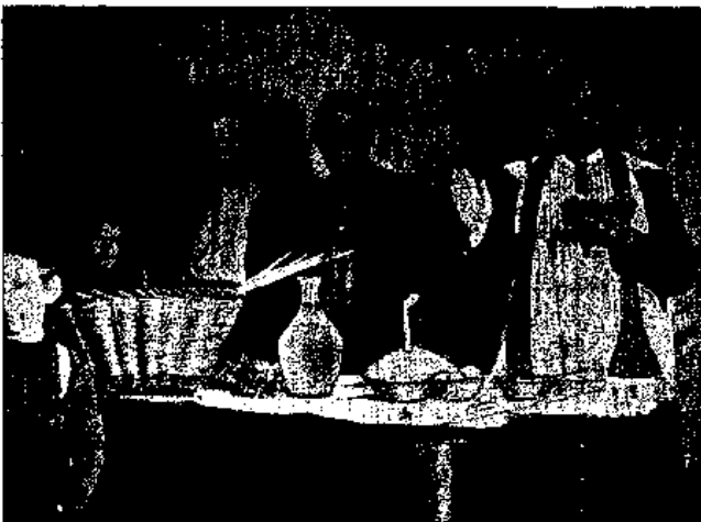
Benedicció de la sal i l'aigua

Aquest antiquíssim costum té a pagès un bell encís i dintre la seva senzillesa revesteix major solemnitat que