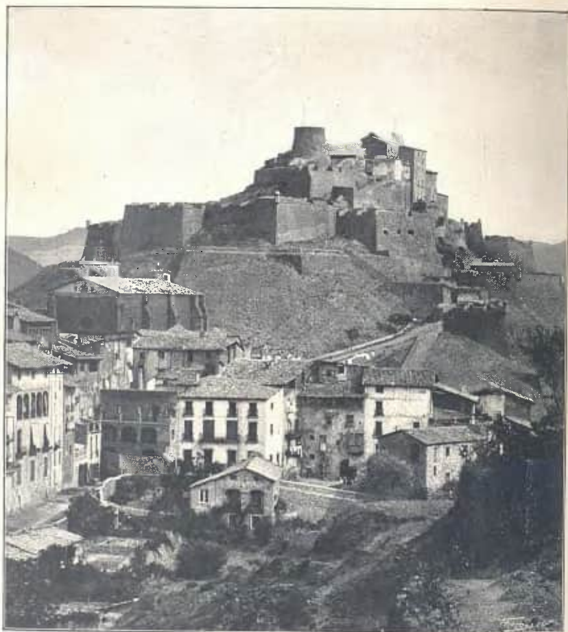
VISTA GENERAL DEL CASTELL DE CARDONA