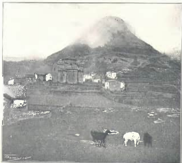
SANT JAUME DE FRONTANYA