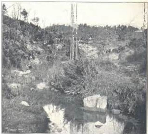
CAMÍ D'ALPENS A LA QUAR. MOLÍ DEL GRAELL