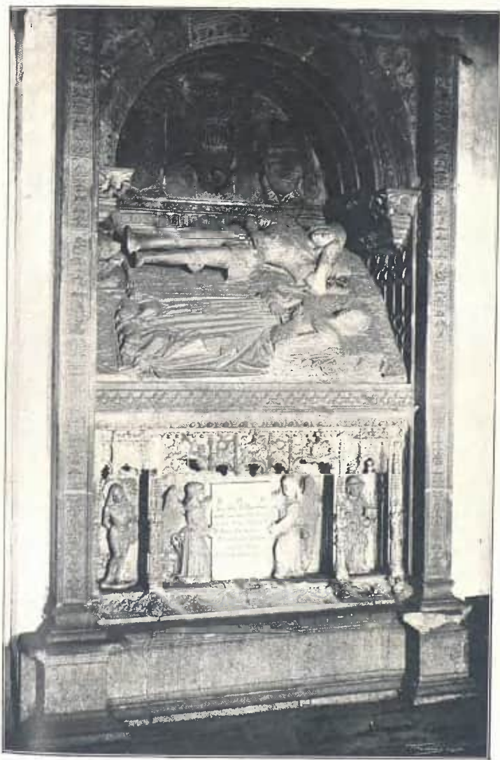
SEPULCRE DEL DUCH FERRANT DE CARDONA