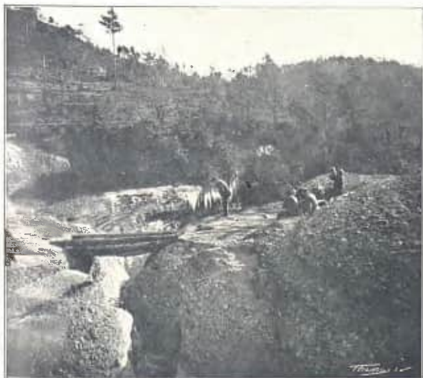
VALL DE MARIÈS, PALANCA DE LA MASADA