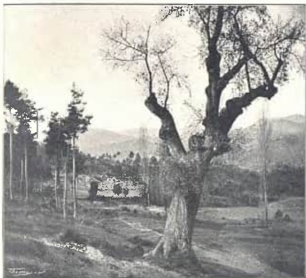
CAMÍ D'ALPENS A LA QUAR