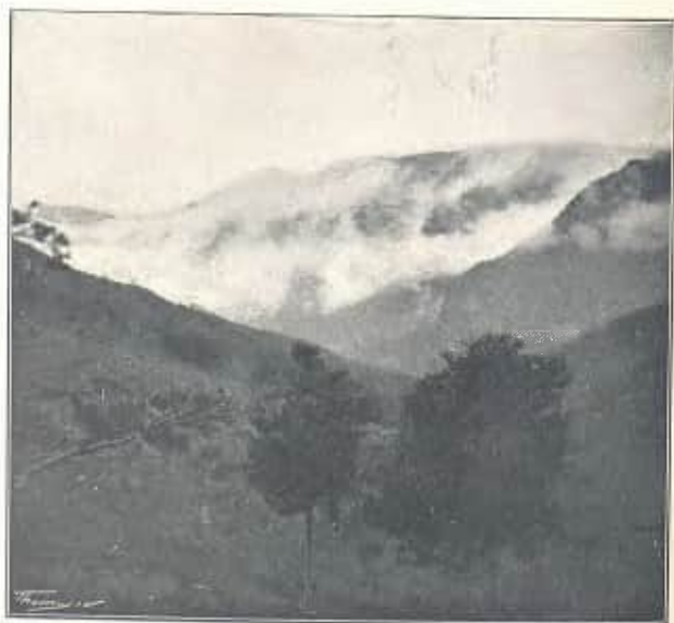
DE VILADA A SANT JAUME DE FRONTANYÀ. COLL DE CERCOSA