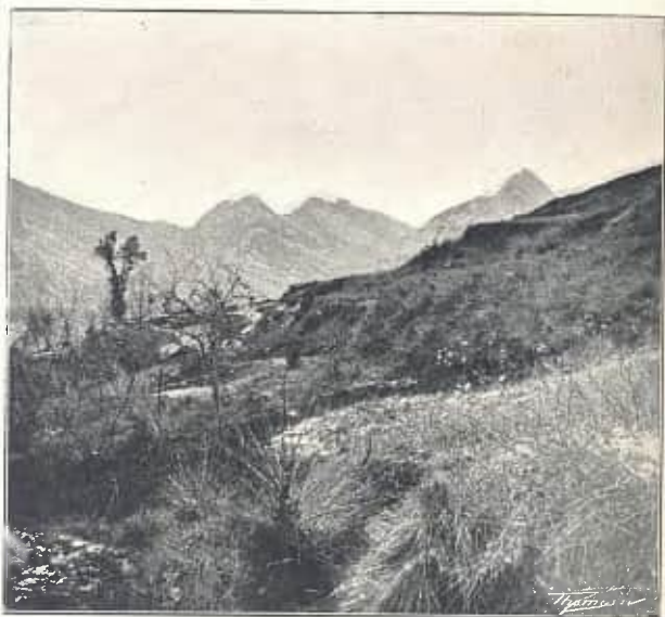
DE VILADA A SANT JAUME DE FRONTANYÀ. VALL DE VILADA