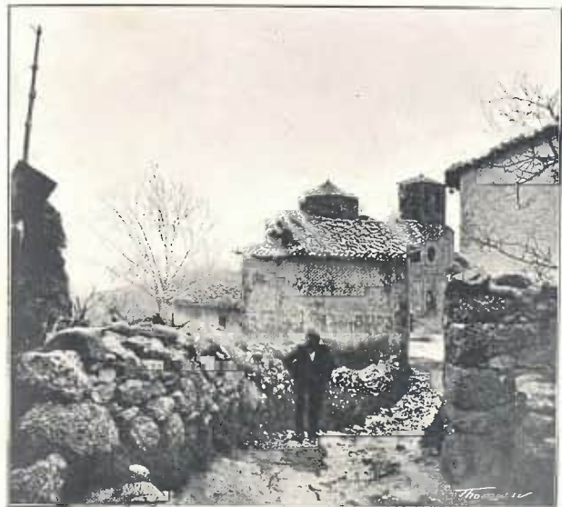
SANT JAUME DE FRONTANYA