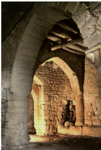
JOAN HUGUET SANS / RAFAEL DALMAU EDITOR

Les comandes urbanes eren centres de poder dels templers als llocs més importants de la Corona i, per