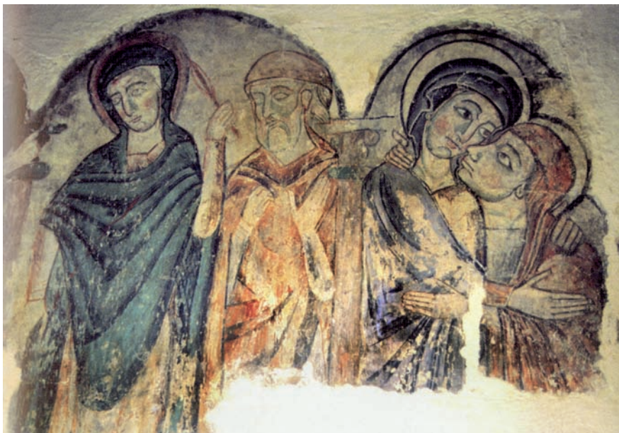
Fresc de l'església de San Bevignate, a Perusa, Úmbria, amb representacions dels templers, a cavall. És un dels conjunts pictòrics templers més importants que es conserven. Fresc de l'església parroquial de Sant Martí, de Puig-reig, al Berguedà, que pertanyia als templers.

Més endavant, la comanda templera de Perpinyà va compartir amb la del Masdéu la capitalitat del Temple rossellonenc.