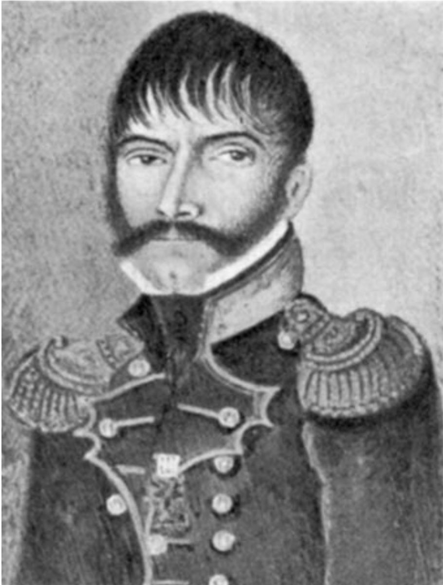
El brigadier Pere Munt i Vilaró, governador militar i polític de Vic.