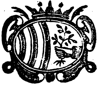
Escut de Mataró. Gravat al boix de la Impremta Abadal.

El gravat de caire religiós fou preponderant, mostra d'un art devot insubstituïble, que penetrà amb una flaire exquisida dins del sentiment dels que el contemplaven. Però el gravat profà també tingué gran acceptació i fou molt divulgat a través de romanços i auques, fulls tan vells com la mateixa impremta, que subministrats amb una certa picantor feia que les multituds s'hi delectessin amb fruïció.