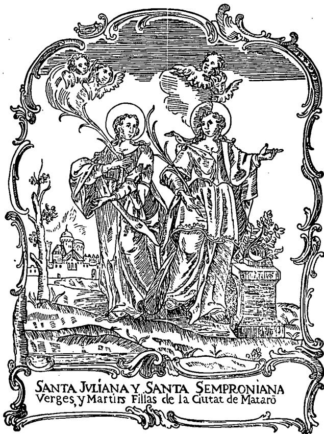
SANTA JULIANA Y SANTA SEMPRONIANA Verges, y Martirs Fillas de la Ciutat de Mataró