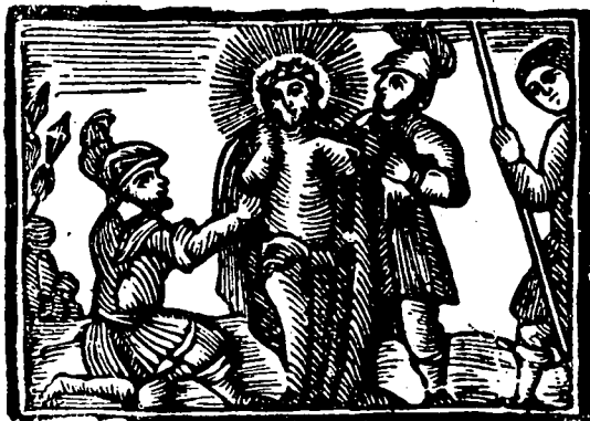
Gravats al boix de la Impremta Abadal.